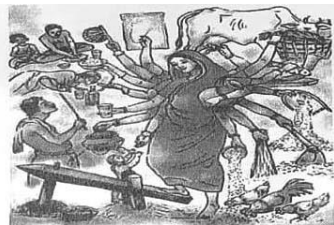
চিত্র : সর্বসংহা নারীর প্রতীকী রূপ